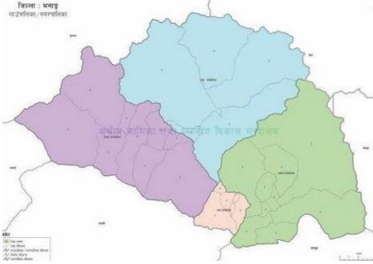
मनाड जिल्लाको नक्शा

सूचनाको हक सम्बन्धी ऐन, २०६४ को दफा ५ र सूचनाको हक सम्बन्धी नियमावली, २०६५ को नियम ३ बमोजिम ३/३ महिनामा सार्वजनिक गर्नुपर्ने विवरण मध्ये २०८२ माघ, फागुन र चैत्र महिनाको विवरण