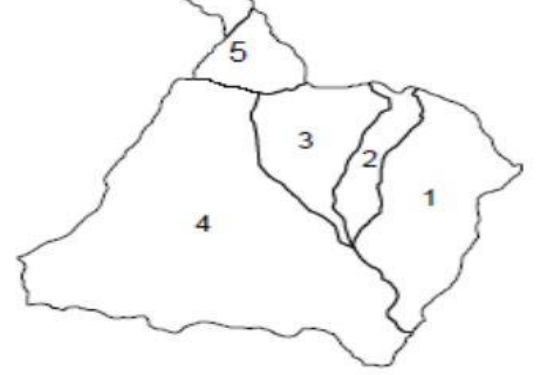
चामे गाउँपालिकाको नक्शा