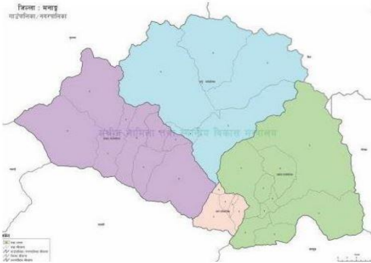
मनाङ जिल्लाको नक्शा

सूचनाको हक सम्बन्धी ऐन, २०६४ को दफा ५ र सूचनाको हक सम्बन्धी नियमावली, २०६५ को नियम ३ बमोजिम ३/३ महिनामा सार्वजनिक गर्नुपर्ने विवरण मध्ये २०७८ (श्रावण, भाद्र, असोज) महिनाको विवरण