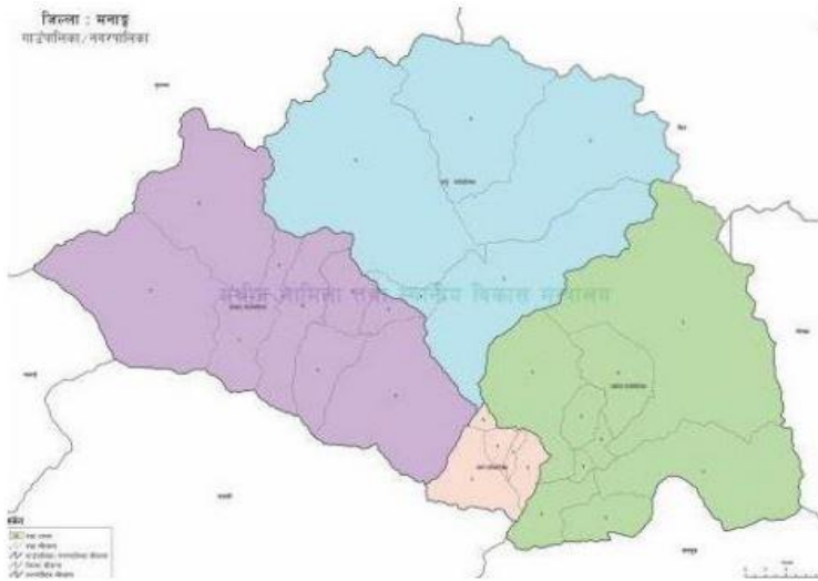
मनाङ जिल्लाको नक्शा

सूचनाको हक सम्बन्धी ऐन, २०६४ को दफा ५ र सूचनाको हक सम्बन्धी नियमावली, २०६५ को नियम ३ बमोजिम ३/३ महिनामा सार्वजनिक गर्नुपर्ने विवरण मध्ये २०७८ (माघ, फाल्गुन, चैत्र) महिनाको विवरण