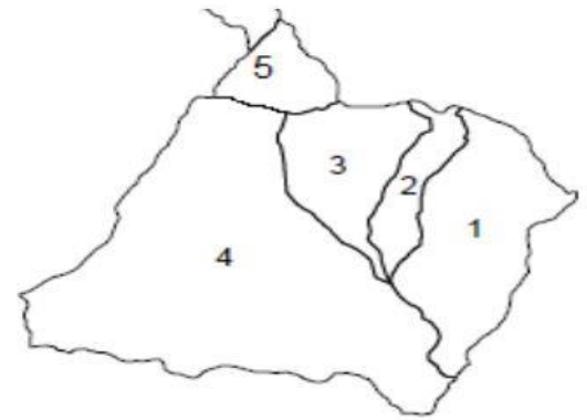
चामे गाउँपालिकाको नक्शा