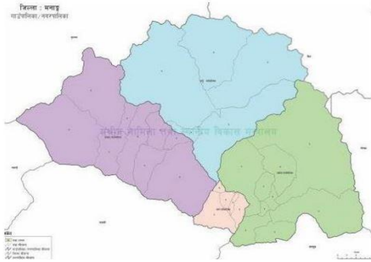
मनाङ जिल्लाको नक्शा

सूचनाको हक सम्बन्धी ऐन, २०६४ को दफा ५ र सूचनाको हक सम्बन्धी नियमावली, २०६५ को नियम ३ बमोजिम ३/३ महिनामा सार्वजनिक गर्नुपर्ने विवरण मध्ये (कार्तिक, मंसिर, पुष) महिनाको विवरण